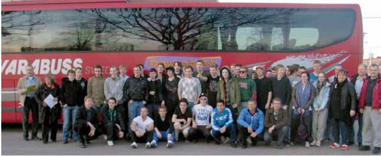
Vår Europaresa startade vid åttatiden förra fredagen med Bergkvarabuss från Kristinehamns järnvägsstation.