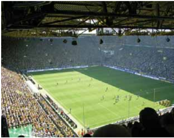
Signal Iduna Stadion är med sina 80 000 åskådarplatser den största i Tyskland.